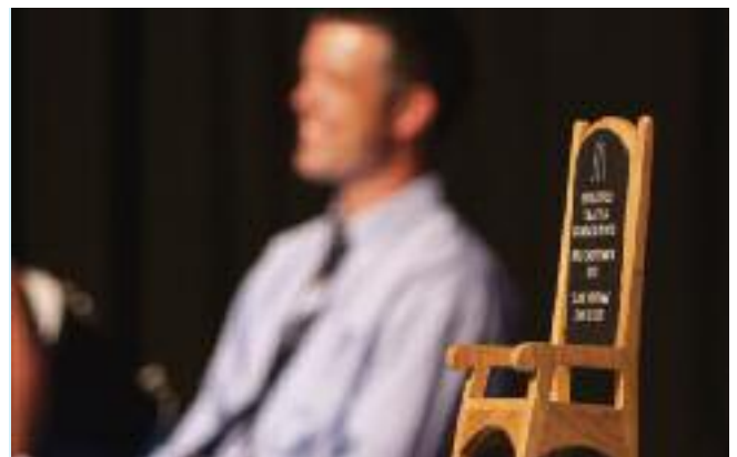
Uchod: Tlws yr Ifanc, Eisteddfod Powys, Isod: Cadeirio 2013