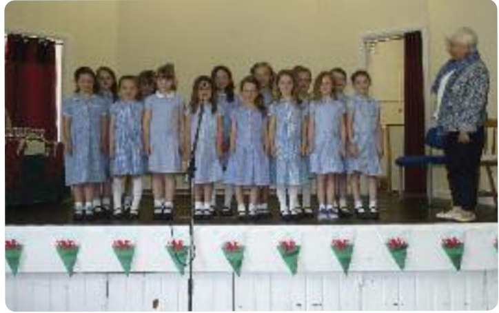
Parti Canu dan 12 lleol . 1af Ysgol Gynradd yr Hendy, yn Eisteddfod yr Hendy.