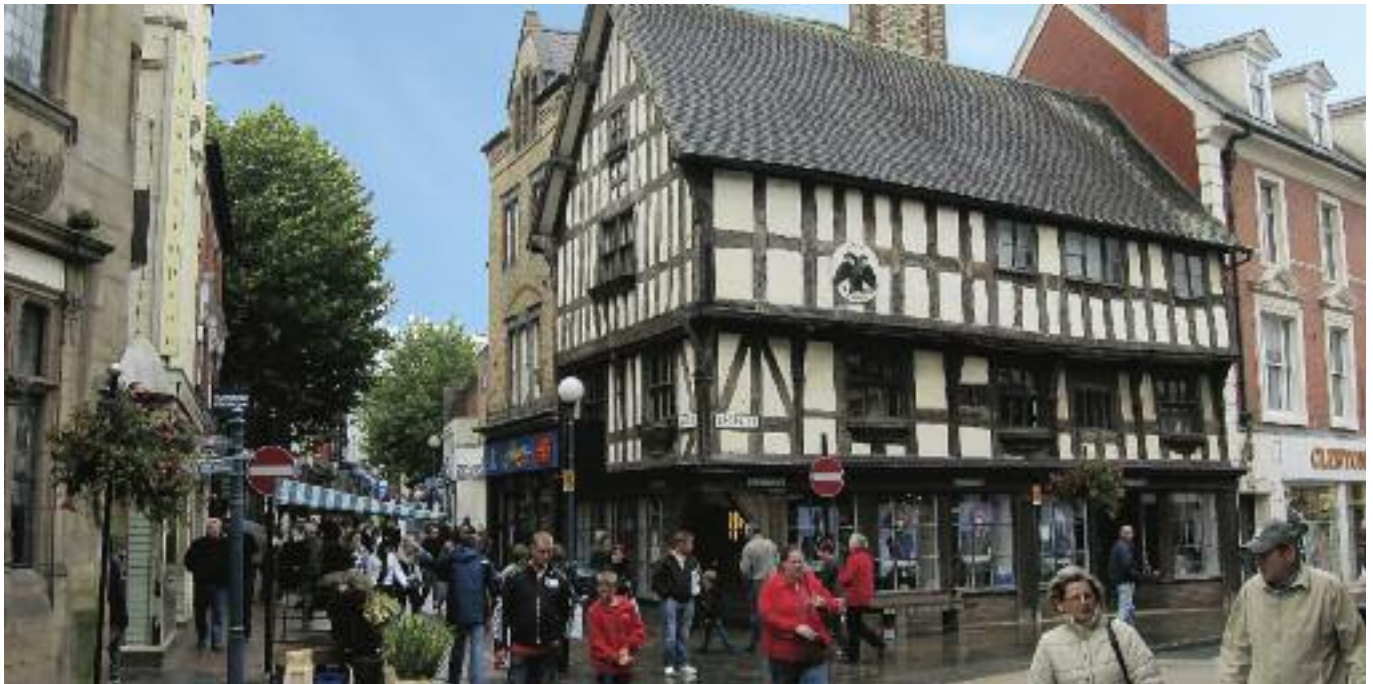
Croesoswallt, cartref Eisteddfod Powys 2016.

Am y tro cyntaf erioed, fe dybir, bydd gan Eisteddfod Talath a Chadair Powys stondin ar Faes yn yr Eisteddfod Genedlaethol. Mae hyn yn bennaf oherwydd bod dalgylch Eisteddfod Powys a thalgylch yr Eisteddfod Genedlaethol ym Meifod eleni fwy neu lai yr un. Yn sgil y ffaith bod caredigion yr ardal wedi bod yn brysur yn casglu arian tuag at goffrau'r Brifwyl ers dwy flynedd, 'doedd neb yn awyddus iawn i dderbyn Eisteddfod Powys yn 2016, na'r gwaith o godi arian tuag ati, nes i ardal Croesoswallt benderfynu ddod i'r adwy a'i chrosawu.