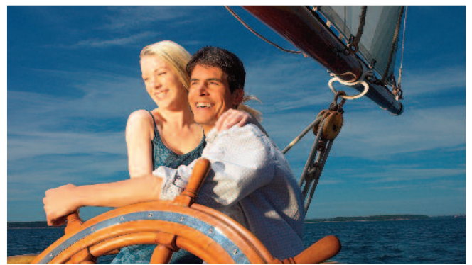
Llun o'r maint cywir - ('resolution' uchel 300dpi) - clir a safonol